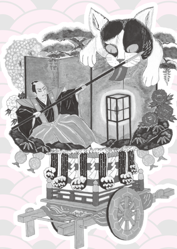
上町組 鍋島化け猫騒動