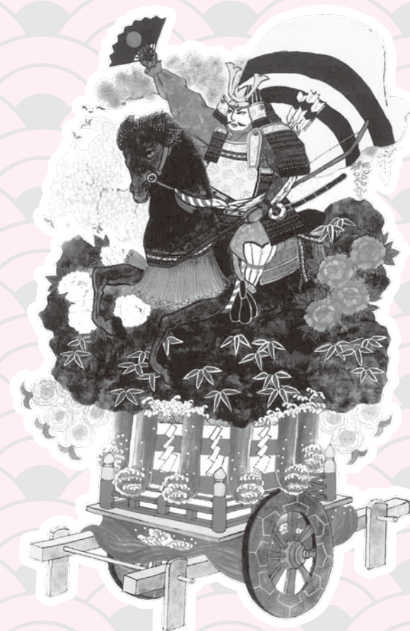
本組 熊谷次郎直実