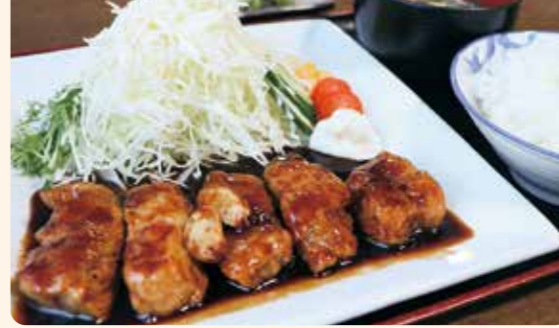
大人気の「トテキ定食/1,000円」。 ライスの大きさは小・中・大から選べます