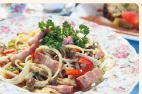
ランチセットはデザートとこだわりの水出しコーヒー付。「ランチバスタセット/1,300円」