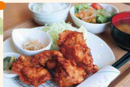
「カリッ、じゅわ〜」と食欲そそる特製「から揚げ定食/980円」

「結」の心を大切に、地産地消ランチや地元奥中山のジャージー牛乳を使ったソフトクリームを提供しています。お土産やおやつに人気の「手作りクッキー」や「大判焼き」。真心のこもった味にリピート間違いなし!