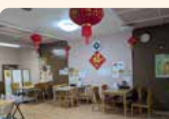
アツアツの「麻婆ラーメン/850円」が人気

住 一戸町西法寺字稲荷21-4 ☎ 080-3087-3659 営 11:00~14:00 17:00~22:00 休 火曜日ランチ P なし 席 29席