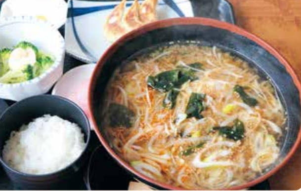
「ねぎ味噌ラーメン」にギョーザとライスのセットがお得。 「ねぎ味噌ラーメン+ギョーザとライスのセット/1,080円」