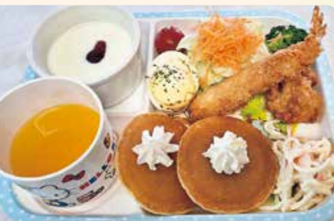
「もぐもぐランチ/800円」はお子様人気の定番メニュー!

住 一戸町奥中山字西田子 662-1 ☎ 0195-35-3131 🕒 4月~11月/11:00~21:00(20:30LO) 12月~3月/11:00~20:30(20:00LO) 🔥 なし 📺 150台(大型バス5台) 🍽️ 68席(座敷32席)