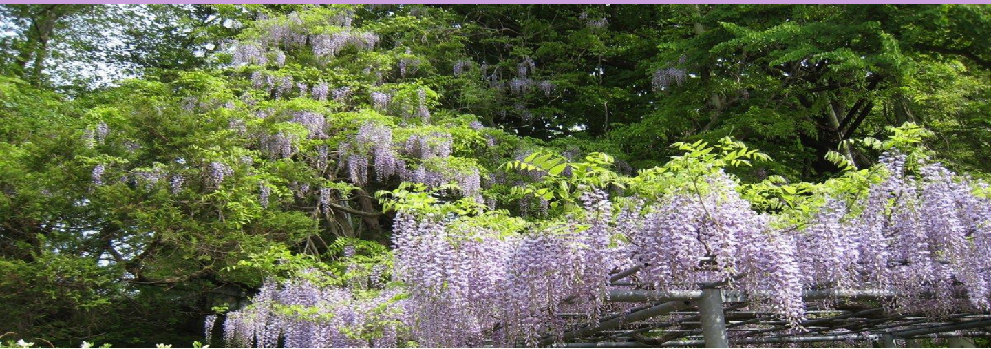
▲ 藤島のフジ（令和7年5月17日の様子）