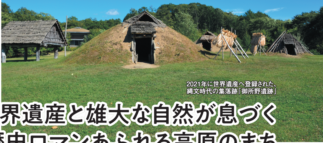
2021年に世界遺産へ登録された、縄文時代の集落跡「御所野遺跡」